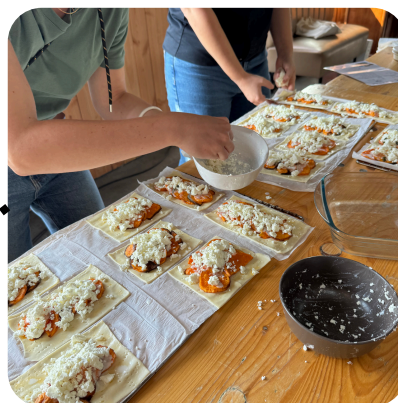
Journée accords Mets et Vins avec une cheffe