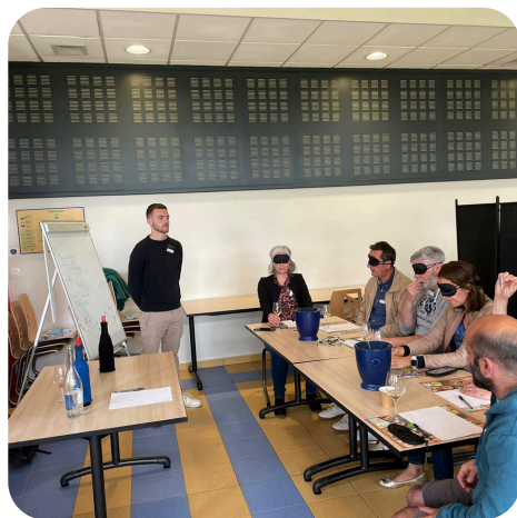
Organisation d'ateliers de dégustations