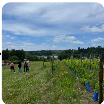
Visites de vignobles et de distilleries